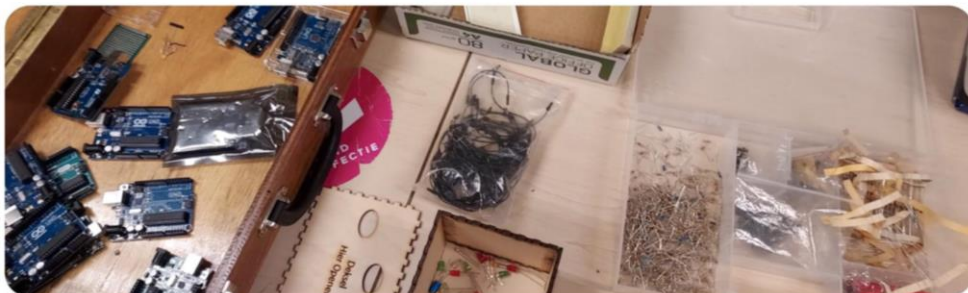
Impressie van MAD